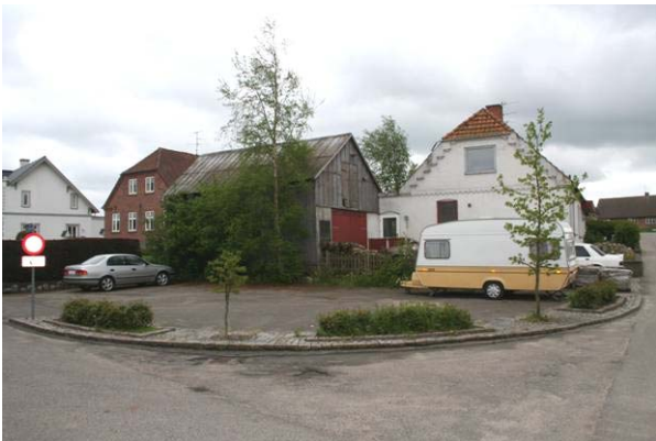
Parkering i Hundslev

Indretning af bygninger og offentlige arealer skal ske på en måde, så de er fleksible og kan tilpasses til de forskellige brugerbehov, der kan opstå i løbet af et menneskes livsforløb. For at sikre dette indeholder lokalplanen bestemmelser om tilgængelighed.