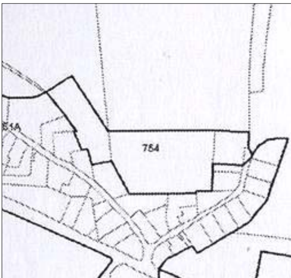
Arealer til nybyggeri i lokalplanens område