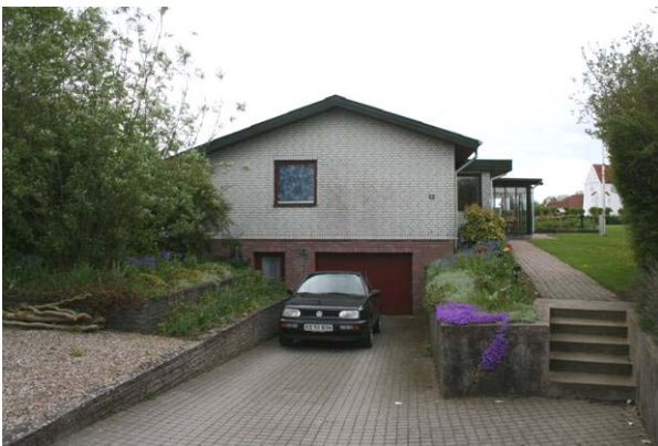
Der er fra mange bygninger i de tre landsbyer udsigt til kirken

Landsbyerne og landdistrikterne skal være gode leve- og bosteder. De skal være attraktive bosteder og et alternativ til bylivet.