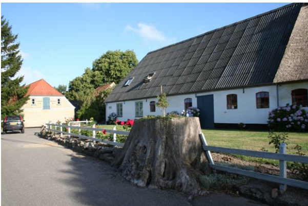
De gamle træer falder til sidst, der bør til stadighed plantes nye på de steder hvor de naturligt kan finde en plads i forhold til den nutidige brug af bygninger og opholdsarealer.

Lokalplanen søger ikke at regulere til ensartethed; men anviser en række muligheder indenfor de traditionelle hegnsformer: Klippede hække, malede stakitter, hegnsmure i glat eller kalket murværk, stendiger, træerækker eller kombination af disse former.