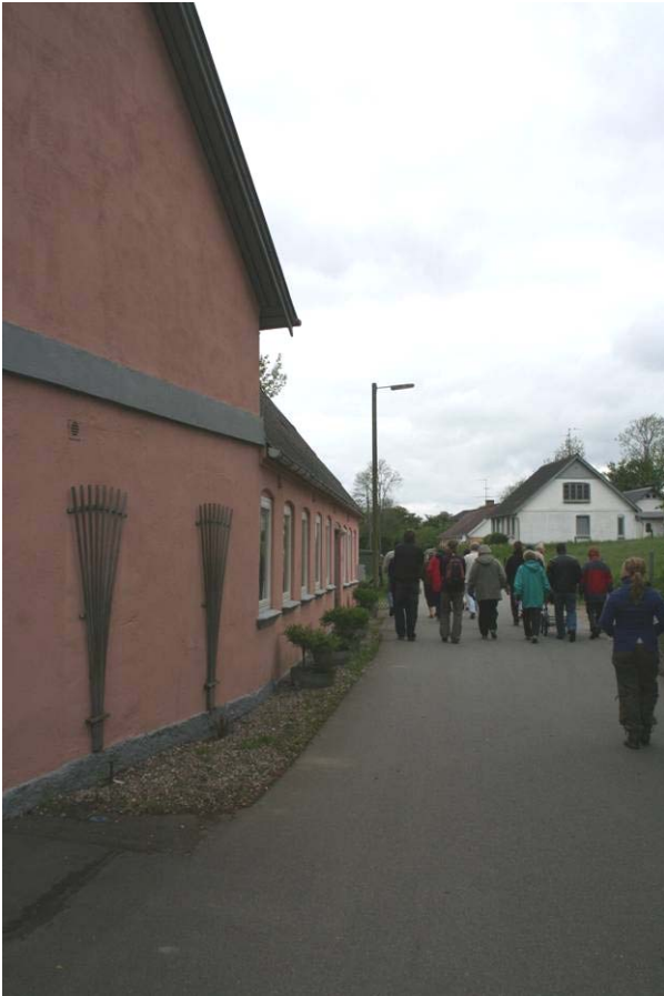
Engvej, byvandring forår 2006

Fokusgruppernes forslag er et solidt forarbejde til udvikling af landsbyerne. Efter den første rapportering har der været holdt møde med grupperne om en vejledning om ombygning, renovering og bevaring af husene i landsbyerne.