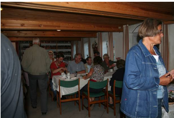
Fælles kaffe efter byvandring i Almsted