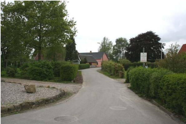
Vejene i de tre landsbyer fungerer både som kørebane, fortov, legeplads og mødested